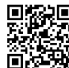
Von Sabine Stöckmann

Informationen zur Benefiz-Radtour gibt es unter https://www.sonnenscheintour.de .