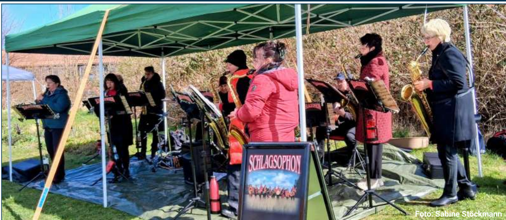
Das Ensemble „Schlagsophon“ im Klützer Stadtgarten

Am Ostermontag, den 6. April 2026, verwandelte sich der Klützer Stadtgarten in ein buntes Osterparadies für Jung und Alt. Bei strahlendem Sonnenschein – und trotz heftigen Windes – lockte der Ostermarkt zahlreiche Besucherinnen und Besucher zum Bummeln, Entdecken und Genießen.